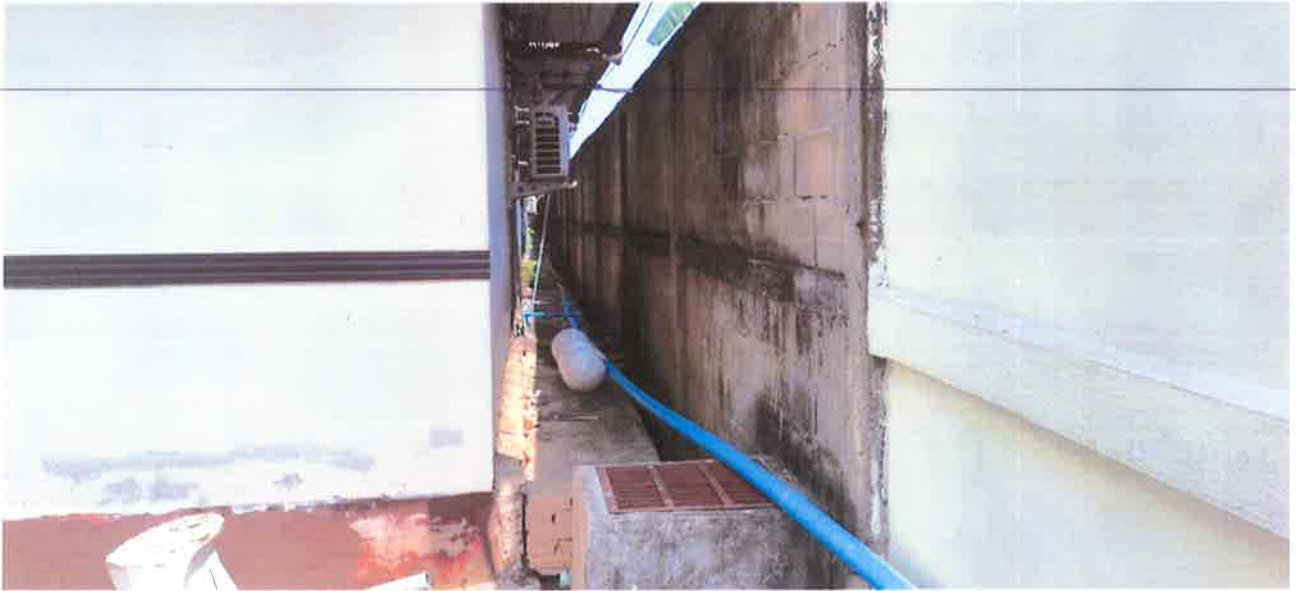
๓. จันทร์ส่องแสง วิลล่า วันที่ ๒ มิถุนายน ๒๕๖๖