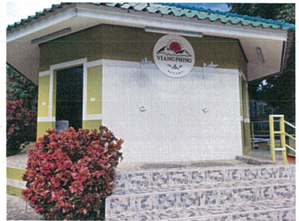
๓. สบายรีสอร์ท วันที่ ๒๒ กรกฎาคม ๒๕๖๕