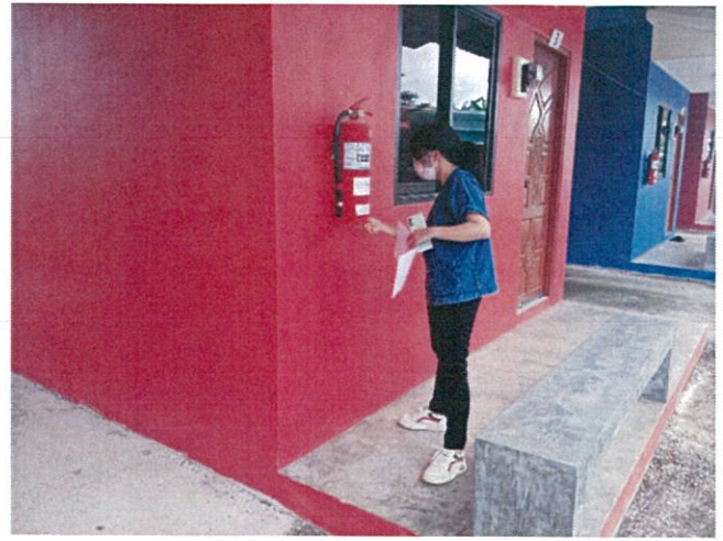
๔. โรงแรมธารทิพย์ วิลล่า วันที่ ๙ กันยายน ๒๕๖๕